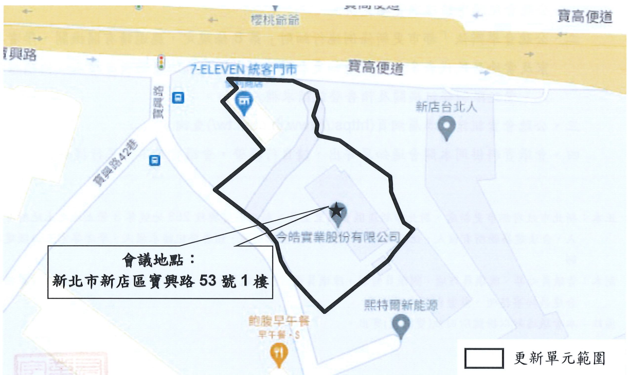
圖 2 開會地點位置示意圖